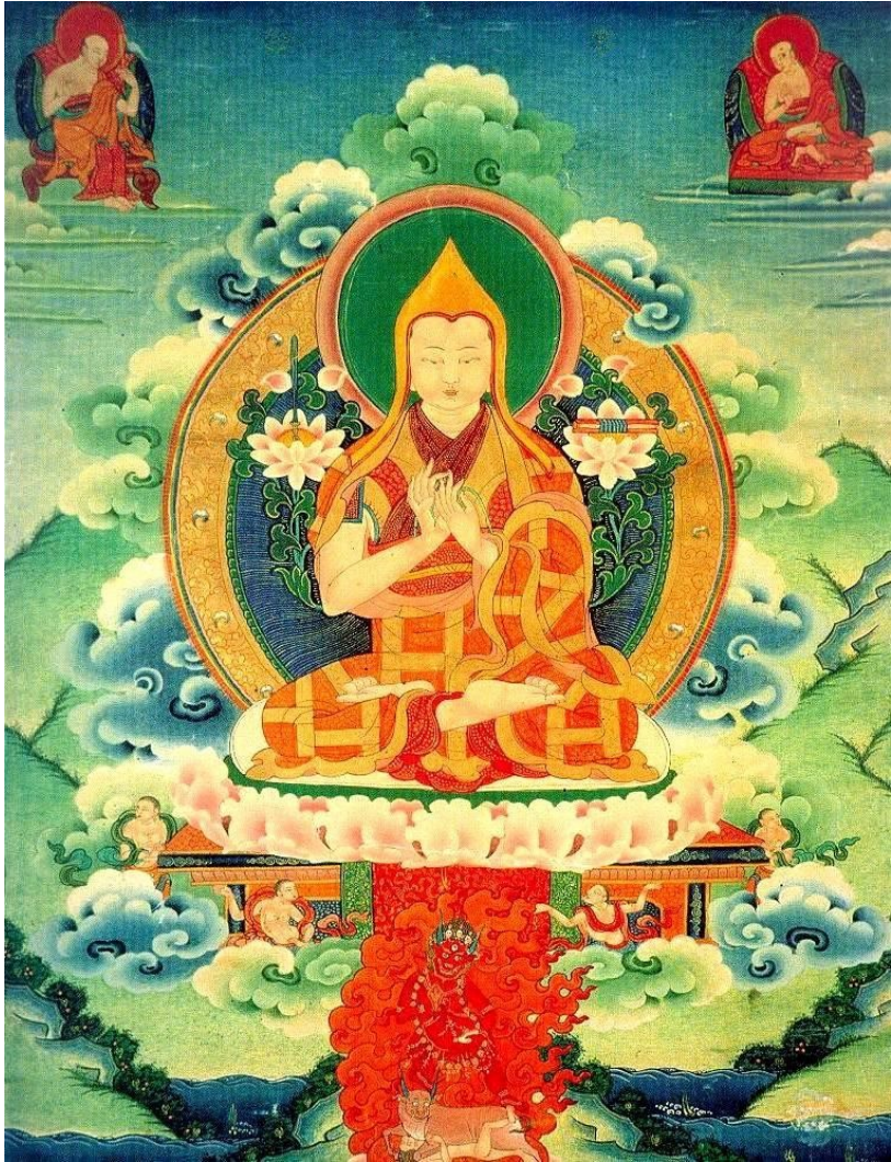
Tsongkhapa Losangdrakpa (1357 - 1419) – རྗེ་ཙོང་ཁ་པ་སློབ་བཟང་གྲགས་པ།